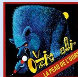
LA PEAU DE L'OURS (2010)